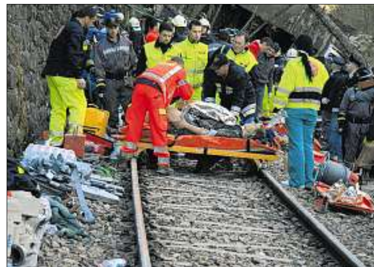
Rettungshelfer bergen einen Verletzten beim schwersten Zugunglück im Südtirol.

Schlammlawine entweder getötet oder verletzt worden. «Das ist ohne jeden Zweifel die schlimmste Zugtragödie, die wir jemals in der Provinz Bozen gehabt haben», erklärte Durnwalder. Es verstärkte sich im Laufe des Tages der Verdacht, dass ein geborstenes Bewässerungsrohr zu dem Erdbeben geführt haben könnte. (sda)