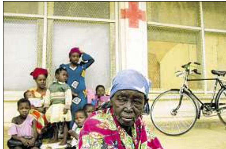
Warten auf Behandlung: Rotkreuz-Spital in Bunia, Kongo.