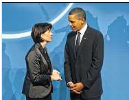
US-Präsident Obama begrüsst Doris Leuthard in Washington.

Zu Beginn der Hauptberatungen am internationalen Atomgipfel in Washington rief der US-Präsident die Teilnehmer erneut eindringlich