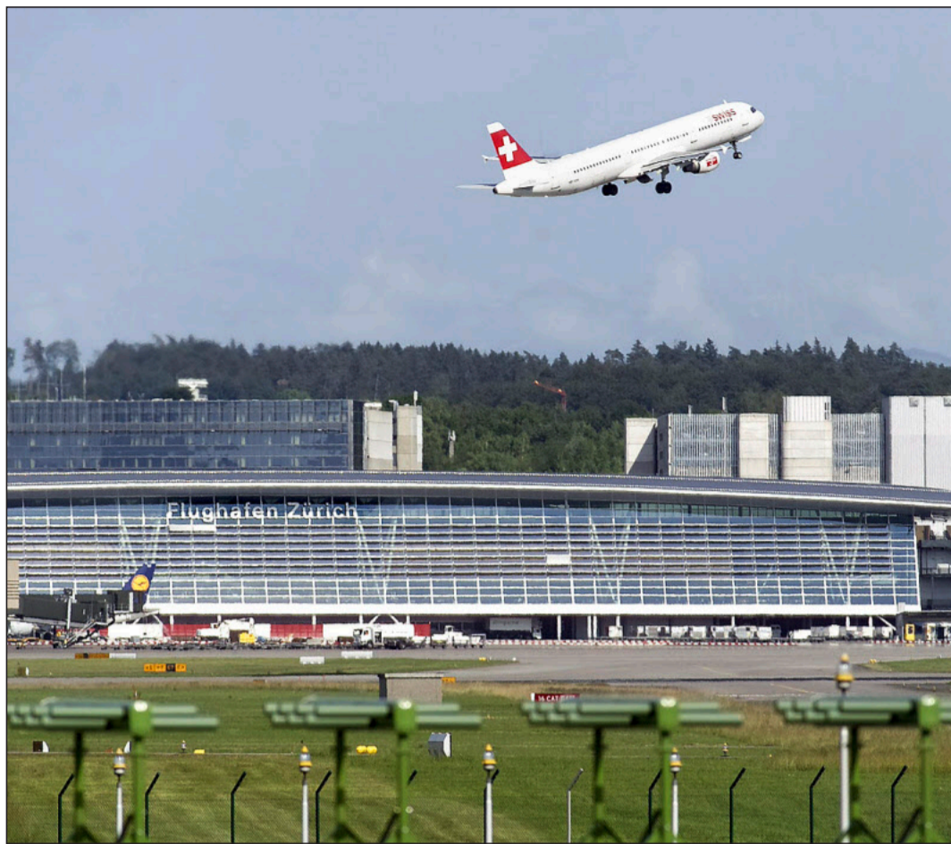
Den Verantwortlichen des Flughafens Zürich und der Swiss macht der Widerstand der Anwohner Sorgen.